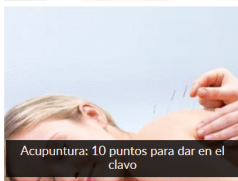
Acupuntura: 10 puntos para dar en el clavo