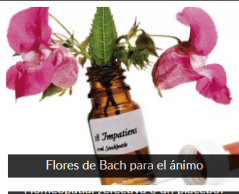
Flores de Bach para el ánimo